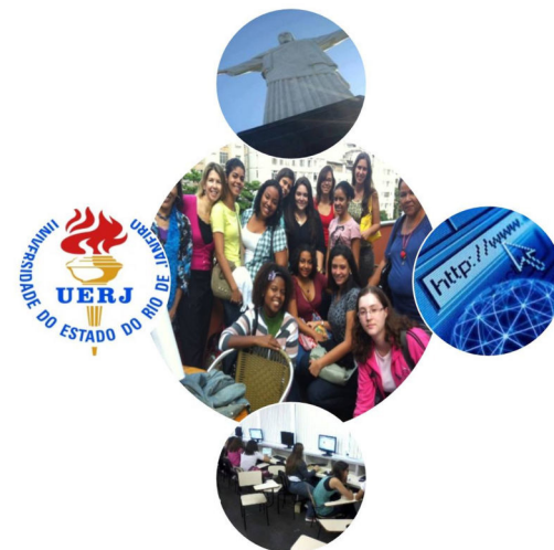
Figura 1 - Representação criada pelas autoras a partir da interface praticantes culturais/ universidade/cidade/ ciberespaço

práctateoriaprática 7 na medida em que ao criarmos os atos de currículo também teorizamos sobre nossas práticas.