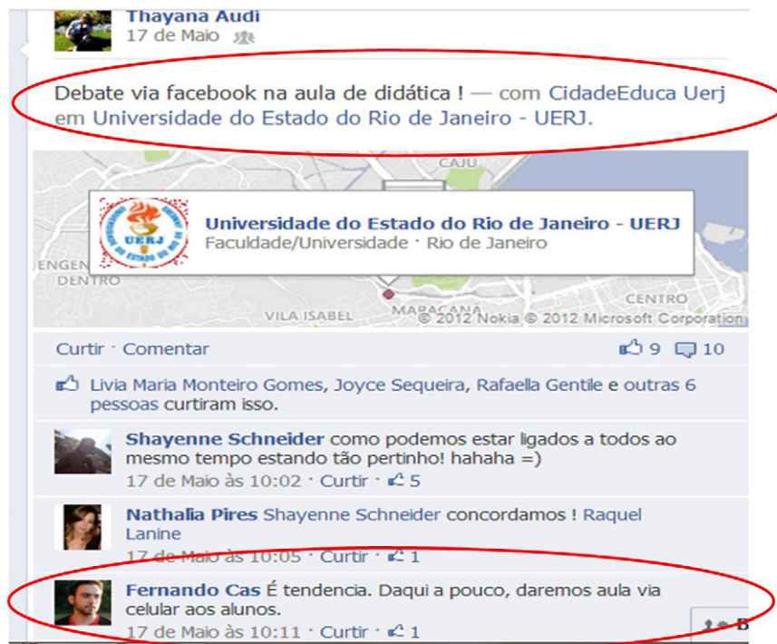
Figura 3 - Ambiente do CidadeEduca UERJ

É nessa perspectiva que trazemos a discussão abaixo, anunciando o celular como uma “tendência” na sala de aula: